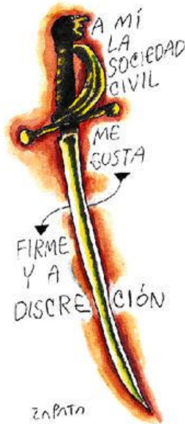
GRAFICO No. 4: LA VISION OFICIAL DE LA SOCIEDAD CIVIL, SEGUN EL HUMORISTA ZAPATA

En alguna medida los argumentos de los partidarios de la Teoría del Estado cobran fuerza cuando se analiza el limitado grado de asociacionismo existente en Venezuela. Es posible ver la participación de la sociedad civil como limitada y 'elitesca', de acuerdo al concepto Hegeliano cuando se considera que sólo un 37% de los venezolanos