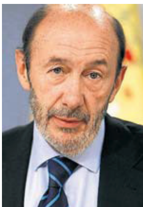
— PÉREZ RUBALCABA — Ingressat a l'UCI per una infecció urinària