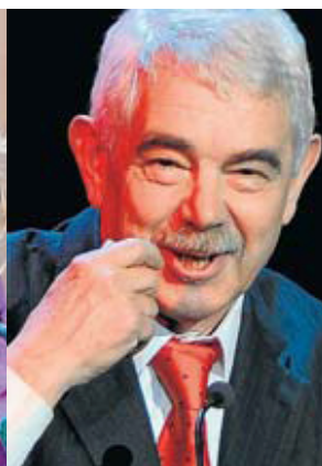
— PASQUAL MARAGALL — Pateix Alzheimer i lidera la lluita contra la malaltia