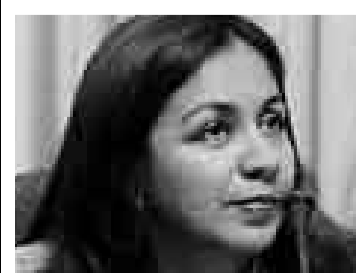
MARISOL ESPINOZA PARTIDO NACIONALISTA

“Humala tiene mayor respaldo en provincias”